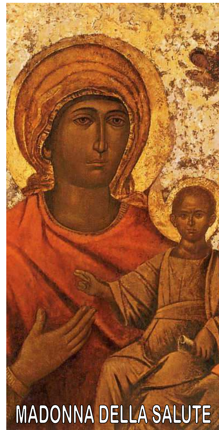
MADONNA DELLA SALUTE

M aria ha attraversato più di una notte nel suo cammino di Madre. Non era semplice rispondere con un "sì" all'invito dell'angelo: eppure lei risponde con coraggio. Maria accoglie l'esistenza così come essa si consegna a noi, con i suoi giorni felici, ma anche con le sue tragedie che mai vorremmo aver incrociato. Fino alla notte suprema, quando il Figlio è inchiodato al legno della croce. Maria "stava" nel buio più fitto, ma "stava". Non se n'è andata. Maria è lì, fedelmente presente, ogni volta che c'è da tenere una candela accesa, in un luogo di foschia e di nebbie. E' lì per fedeltà al piano di Dio di cui si è proclamata serva nel primo giorno della sua vocazione. La ritroveremo nel primo giorno della Chiesa, lei Madre di speranza in mezzo a quella comunità di discepoli così fragili. Per questo la amiamo come Madre.